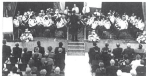
Die rund 50 Musiker der „Imperial Band“ aus Malta unterhalten die Zuhörer mit einem buntem Programm.

Das Publikum zeigte seine Wertschätzung nicht nur durch kräftigen Applaus sondern auch durch reichlich Scheine im Spendenkorb. (gg)